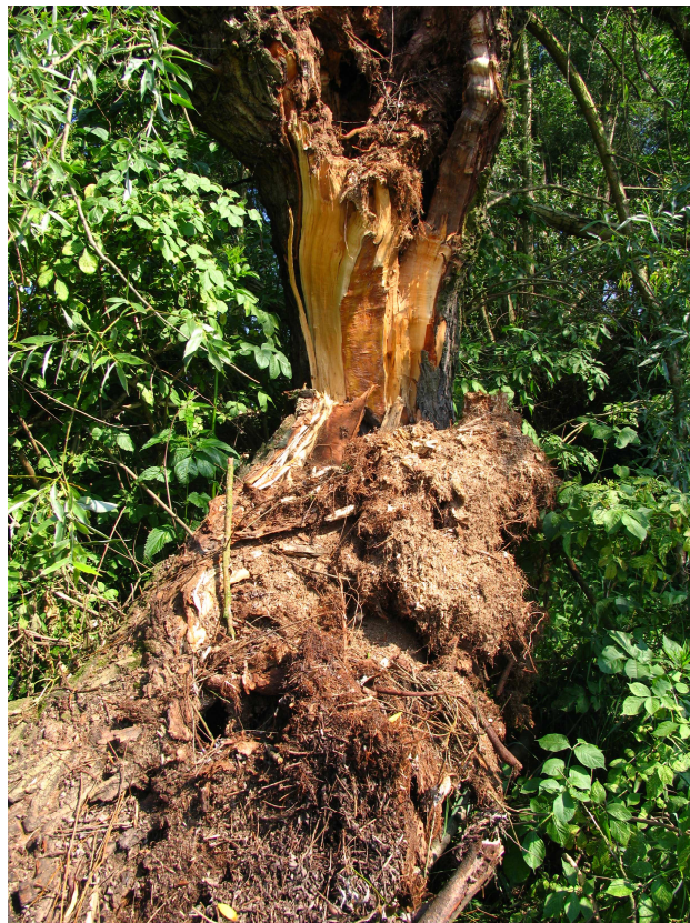
Foto 7 Odłamany konar ogłowionej wierzy ujawnił rozległe wewnętrzne próchnowisko z odchodami pachnicy dębowej (poblize wału przeciwpowodziowego, Dolina Łomiankowska)