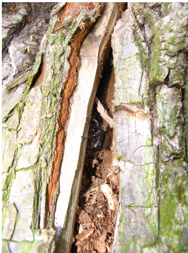
Foto 4 Dorosła pachnica dębowa przy dziupli wierzby nad j. Dziekanowskim