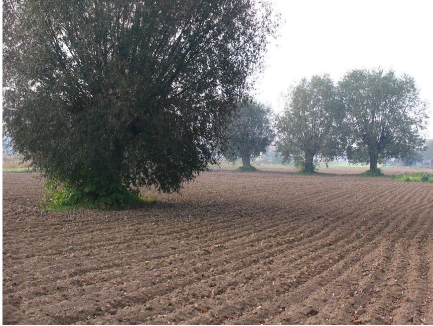
Foto 6 Ogłowione wierzy w pobliżu j. Kiełpińskiego