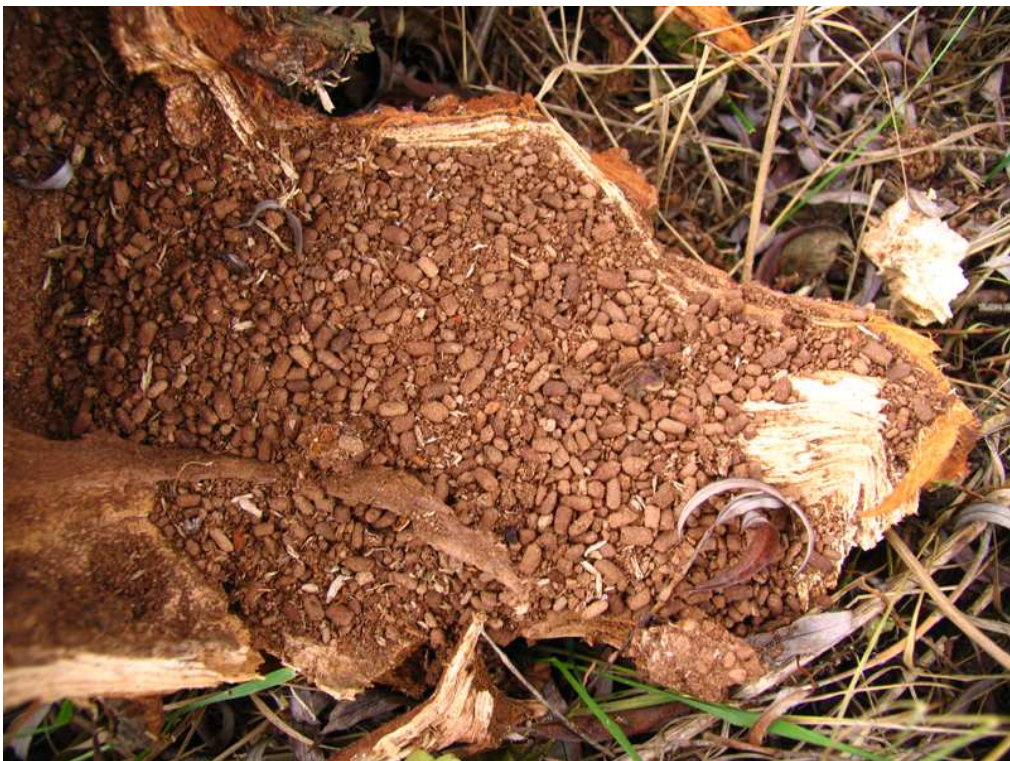
Foto 3 Pachnica dębowa – odchody widoczne na ułamanej konarze wierzby