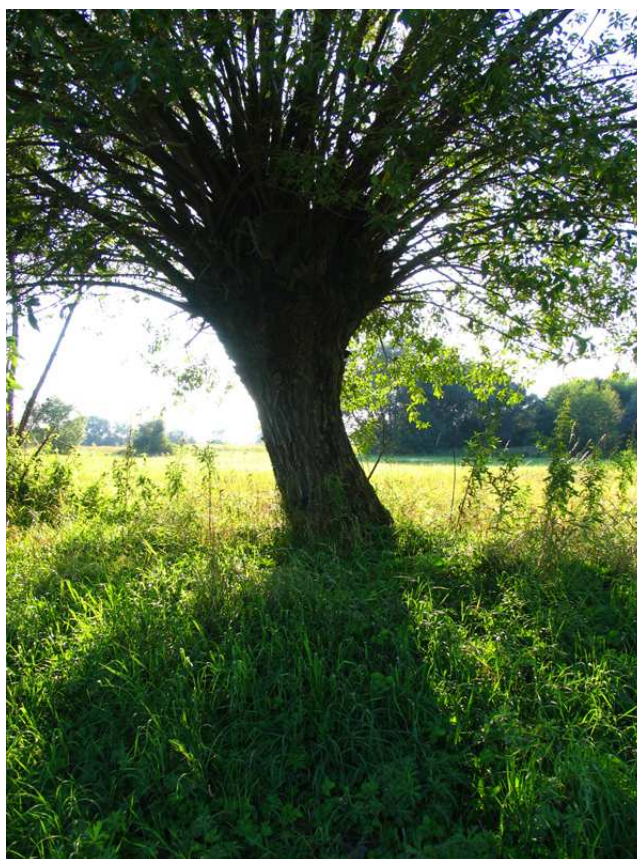
Foto 1 Wierzba głowiasta w pobliżu j. Kiełpińskiego

Celem podjętych badań nad występowaniem pachnicy dębowej w Dolinie Łomiankowskiej jest określenie częstości występowania tego chrząszcza i inwentaryzacja wierzb będących potencjalnym środowiskiem rozrodu gatunku. Niniejszy raport przedstawia dane o częstości i miejscach występowania stadiów larwalnych i dorosłych osobników pachnicy dębowej, oraz uwagi o wytycznych dla praktycznej ochrony tego gatunku w gminie Łomianki.