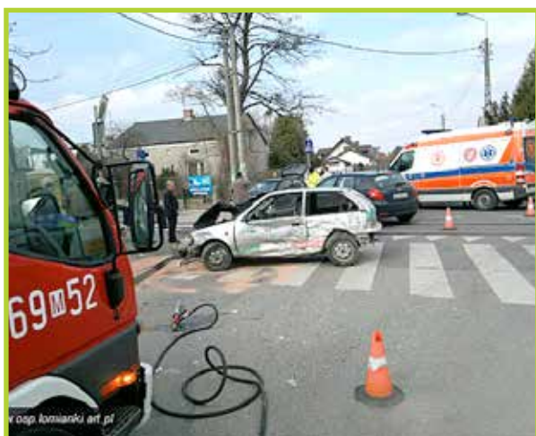
Biorą udział w akcjach ratowniczych po wypadkach