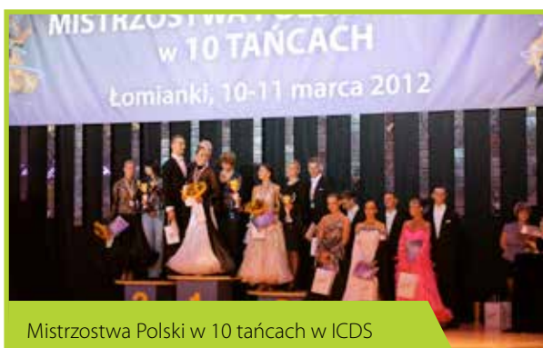
Mistrzostwa Polski w 10 tańcach w ICDS