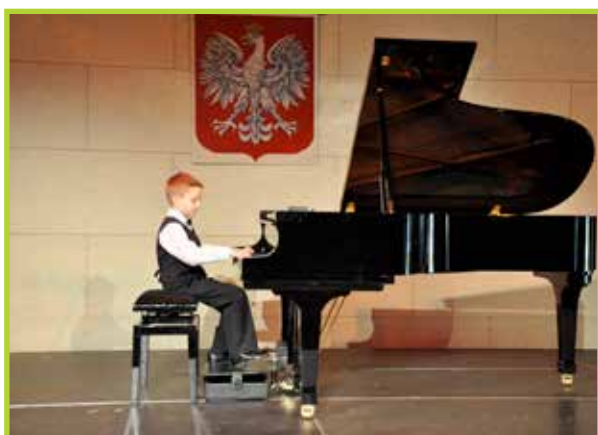
Konkurs Zarębskiego 2012

Od 2010 roku konkurs Zarębskiego awansował w hierarchii ważności konkursów, wstępując do elitarnego klubu ALINK-ARGERICH, zrzeszającego największe konkursy muzyczne, przede wszystkim pianistyczne, na świecie. W tym roku pierwszy raz gala finałowa konkursu odbyła się w Zamku Królewskim w Warszawie.