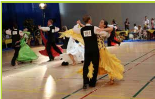
Turniej tańca towarzyskiego Małe Mazowsze