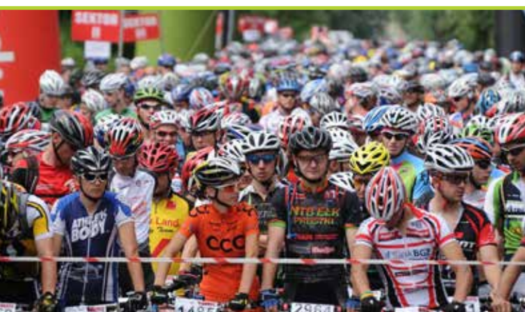
W 2011 roku w Łomiankach wzięło udział ponad 700 uczestników