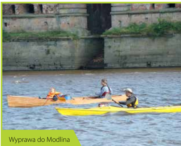
Wyprawa do Modlina