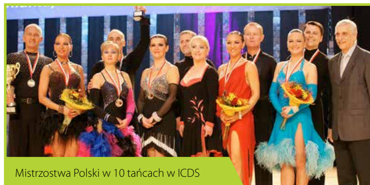
Mistrzostwa Polski w 10 tańcach w ICDS

Stowarzyszenie Rehabilitacji i Tańca Integracyjnego Osób Niepełnosprawnych SWING-DUET to jedyna w Polsce szkoła tańca dla osób niepełnosprawnych mogąca pochwalić się tak wielkimi sukcesami swoich par tanecznych. Zawodnicy SWING-DUET to kadra Polski – obecnie sześć par występujących w międzynarodowych imprezach sportowych – taniec na wózkach. To wielokrotni medaliści Pucharów Świata, Mistrzostw Europy i Polski w tej dyscyplinie. Stowarzyszenie ma także wiele sukcesów w szkoleniu par tanecznych. W tym roku to Łomianki były gospodarzem Mistrzostw Polski w 10 tańcach. 10 i 11 marca 2012 roku w hali ICDS mogliśmy oglądać najlepsze pary taneczne w Polsce.