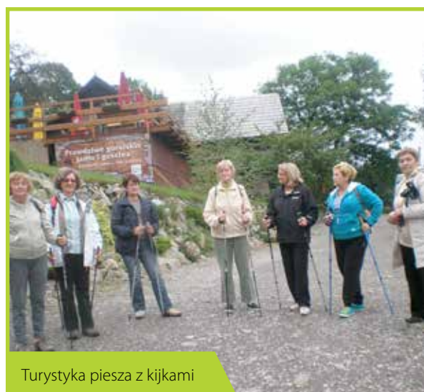
Turystyka piesza z kijkami

Uniwersytet Trzeciego Wieku to chluba Łomianek. Misją stowarzyszenia to „Non progređi est regredi - Nie iść naprzód to cofać się”. Zapewne dlatego UTW ma tak szeroką ofertę. Malowanie, wystawy, kijki, rowery, wspólne wyprawy i odległe podróże, wykłady naukowe, spotkanie literackie, klub przyjaciół książki to tylko część bogatej oferty dla wszystkich uczestników uniwersytetu.