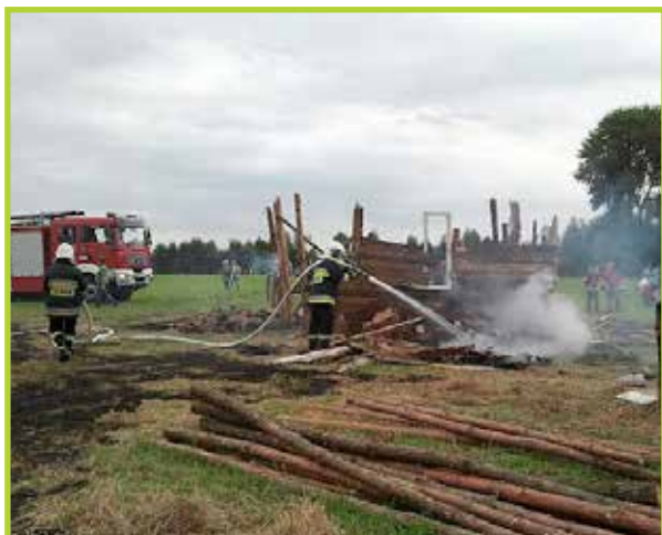
Nasi strażacy zabezpieczali wydarzenie „Bitwa pod Łomiankami 1939”

Ratują dobytek, a nierzadko zdrowie i życie. Walczą z żywiołami oraz usuwają ich skutki, ratują nas z wypadków samochodowych. Oto nasi dzielni strażacy ochotnicy w akcji. Nowoczesnego sprzętu naszej OSP mogą pozazdrościć strażacy zawodowcy.