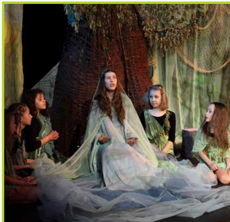
Przedstawienie Goplana- Łata 2011

Z wielkimi sukcesami od lat działa teatr dziecięcy Tygrysek. Liczne nagrody i wyróżnienia na festiwalach dziecięcych plasują Tygryska wśród najlepszych teatrów w Polsce. Poczuj się prawdziwym aktorem.