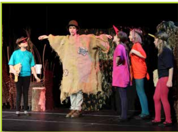
Przedstawienie Strach- Łata 2011