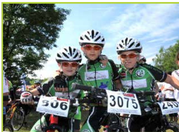
Mazovia MTB Maraton to zawody dla każdego!