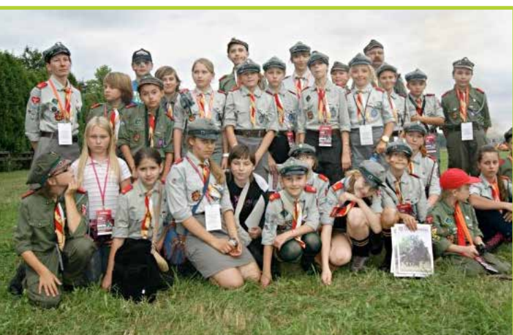
Harcerze pomagali w trakcie „Bitwy pod Łomiankami 1939”