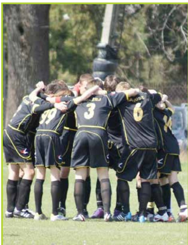
Rocznik 1997 - w jedności siła