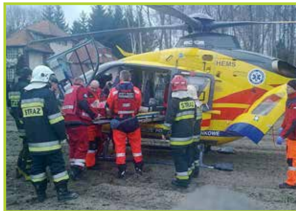
Pomagają w transporcie rannych