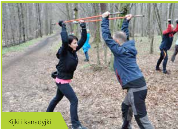
Kijki i kanadyjki