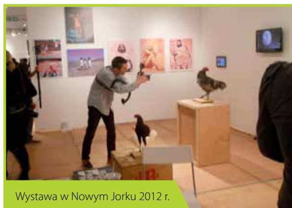
Wystawa w Nowym Jorku 2012 r.

oraz 3 artystów europejskich. W obecnym roku fundacja Faktoria Artystyczna realizuje kolejny raz projekt Artblender dla uczniów gimnazjum nr.1 w Łomiankach.