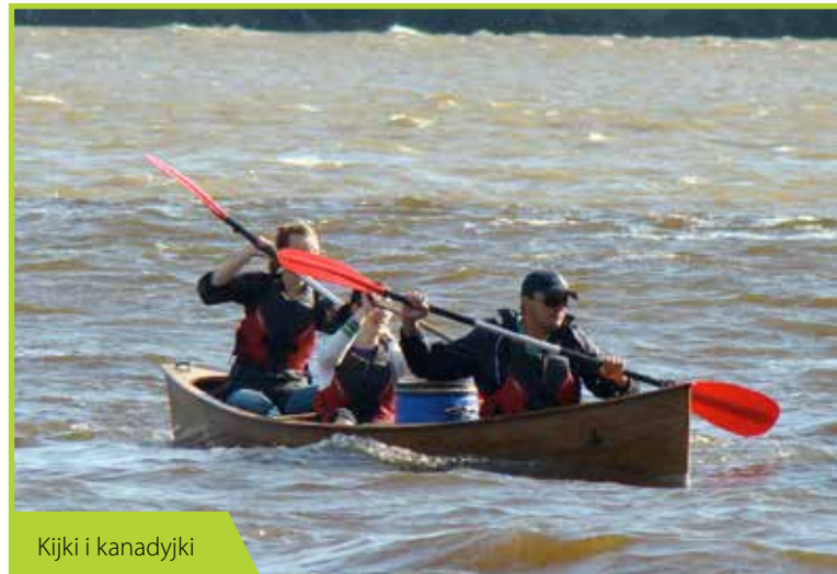
Kijki i kanadyjki

Oprócz tego fundacja realizuje wyjątkowe projekty popularyzujące aktywne spędzanie wolnego czasu „Traperzy znad Wisły”, czyli spływ z Puław do Łomianek – szkoła tippingu, „Kijki i kanadyjki” czyli bezpłatne szkolenia i treningi z Nordic Walking w Puszczy Kampinoskiej. Dodatkowo odbywają się wprawki kajakowe – kanu na Jeziorze Dziekanowskim zakończono spływem po Wiśle z Łomianek do Modlina.