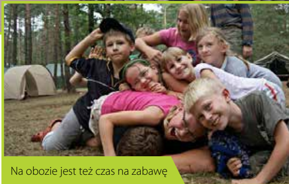
Na obozie jest też czas na zabawę