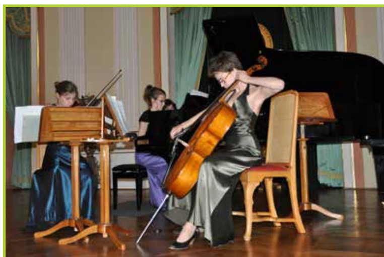
Koncert laureatów 2012 odbył się w Zamku Królewskim w Warszawie