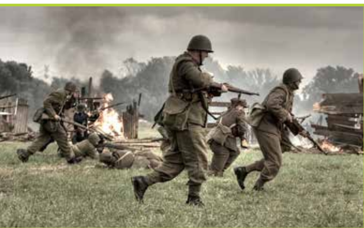
Bitwa pod Łomiankami 22 września 1939