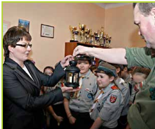
Jak co roku przekazują betlejemskie światelko pokoju

Harcerstwo w Łomiankach w ostatnim roku rozwija się bardzo dynamicznie. W ciągu roku liczba harcerzy podwoiła się i obecnie w Łomiankach mamy ok. 150 harcerzy. Oprócz zdobywania sprawności i obozów harcerskich zawsze są obecni tam gdzie, są potrzebni. Pomagają starszym, jak zawsze biorą udział we wszystkich uroczystościach patriotycznych sportowych i kulturalnych. Zbiórki odbywają się w Szkole Podstawowej nr 1 w Łomiankach i w Dziekanowie Leśnym. Czuwaj!