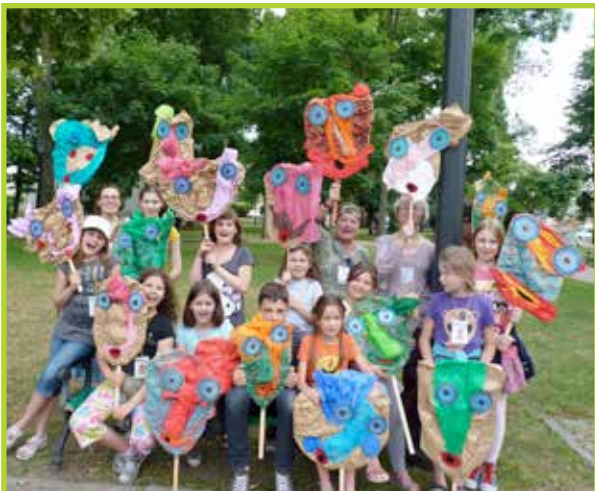
Międzynarodowy Festiwal Teatralny- Wigraszek 2011