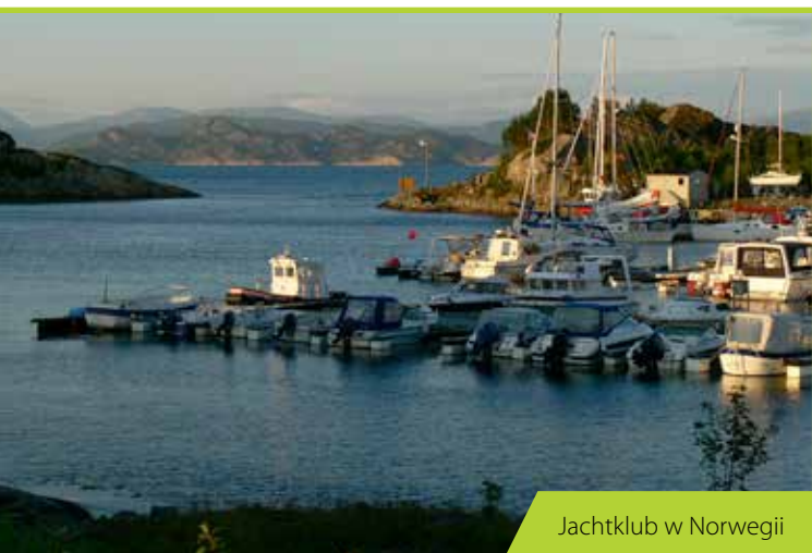
Jachtklub w Norwegii