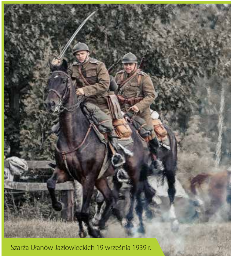
Szarża Ułanów Jazłowieckich 19 września 1939 r.

Na imprezach towarzyszących zaprezentują się najlepsze polskie wydawnictwa historyczne, instytucje kulturalne oraz przedsiębiorstwa, w tym oczywiście przedstawiciele ziemi Łomiankowskiej. Będzie można zobaczyć dioramy grup rekonstrukcji historycznej, wystawy historycznego i współczesnego sprzętu wojskowego, a także obejrzeć efektowne