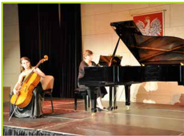
Konkurs Zarębskiego 2012