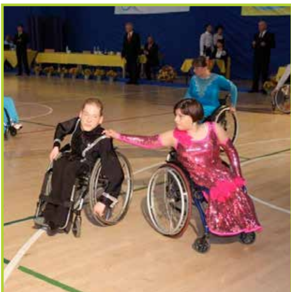
Mistrzostwa Polski w tańcu na wózkach- Łomianki 2012