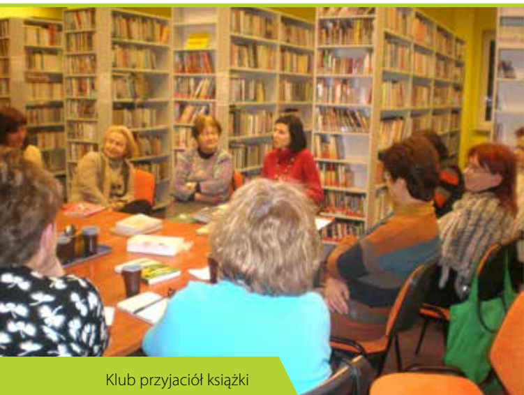
Klub przyjaciół książki