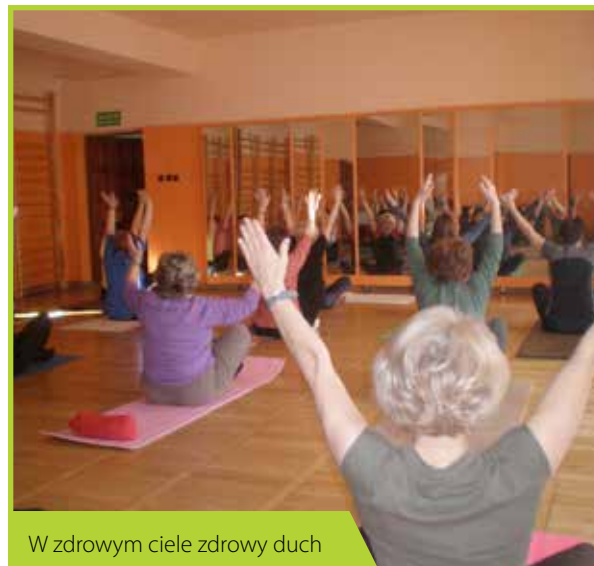
W zdrowym ciele zdrowy duch