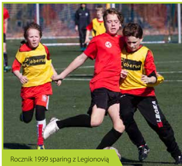
Rocznik 1999 sparing z Legionwią