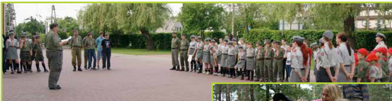
Święto szczeplu Łomianki