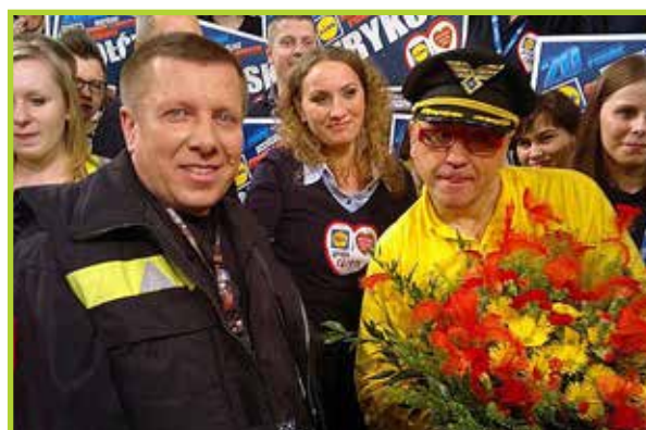
Pomagają w akcjach WOŚP