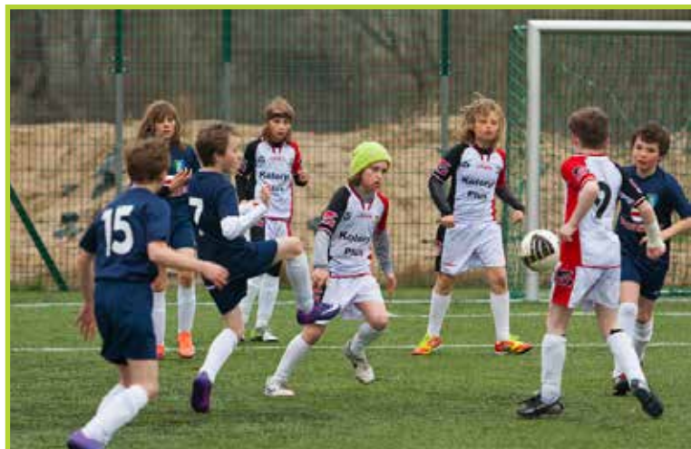
Rocznik 2001 mecz z Bugiem Wyszków

Obecnie w oficjalnych rozgrywkach PZPN klub reprezentuje 148 zawodników, większość to dzieci i młodzież. Klub prowadzi sekcję piłki nożnej od 1993, kontynuując tradycje przedwojennej i powojennej piłki nożnej w Łomiankach. Wychowankowie KS Łomianki grają w klubach od IV do I ligi w całej Polsce. Wśród dzieci i młodzieży nasze zespoły odnoszą znaczące sukcesy, reprezentując Łomianki w Warszawie, na Mazowszu, w Polsce i na turniejach zagranicznych. Profesjonalna kadra trenerska gwarantuje najwyższą jakość szkolenia. Zespół seniorów KS Łomianki bierze udział w rozgrywkach IV ligi- grupa północna.