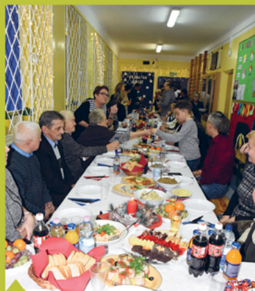
3. Spotkanie w sołectwie Sadowa.