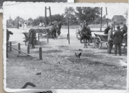
▶ Zajeżdźnia furmanek w Łomiankach, 1940 r.