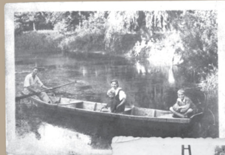
◀ Nad Jeziorem Fabrycznym, 1934 r.