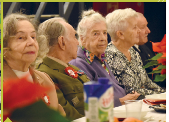
4. Spotkanie z kombatantami i wdowami po kombatantach.

jemskiego światła pokoju – przekazywane przez harcerzy dla wóldarza gminy było optymistycznym akcentem na nowy 2019 rok (fot. 5).