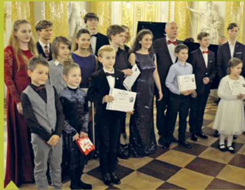
1. XVIII Konkurs muzyczny im. J. Zarębskiego na Zamku Królewskim w Warszawie.

„Światło, które łączy...” przesłanie tegorocznego Betle-