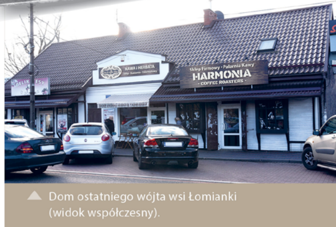
▲ Dom ostatniego wójta wsi Łomianki (widok współczesny).

ZAPRASZAMY DO WSPÓŁPRACY! Cykl „Nasza дума” jest odpowiedzią na postulaty wielu mieszkańców Łomianek, którym zależy na realizacji wizji miasta równie nowoczesnego (ale z bogatą historią), jak i pięknego (ale jednocześnie przyjaznego ludziom). Uważasz, że warto prezentować Łomianki inwestorom i turystom i najnowszym mieszkańcom i najmłodszemu pokoleniu z rodzin zamieszkałych od dawna. Czekaemy na Ciebie! biuletyn@lomianki.pl