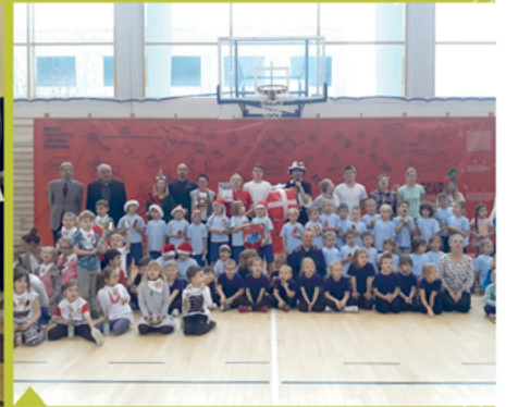
2. Finał Ligi Przedszkolaka w ICDS.