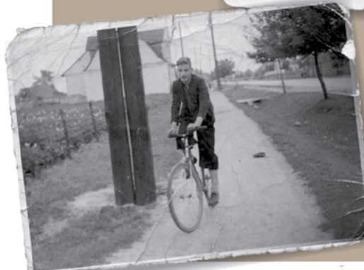
◀ Główna ulica Łomianek – ul. Warszawska, lata 40.