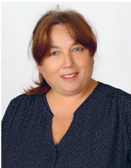
FOT.: STUDIO 222

Uważam, że rolą radnego jest służyć społeczności lokalnej oraz być wyrazicielem potrzeb mieszkańców. Bardzo liczę na „nową jakość” w urzędzie gminy. Mam nadzieję, że nowe władze zaczną rozmawiać i słuchać lokalnych społeczności i będą starały się – przy zachowaniu równowagi – realizować ich postulaty.