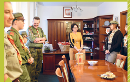
5. Betlejemskie światło pokoju.

jemskiego światła pokoju – przekazywane przez harcerzy dla wóldarza gminy było optymistycznym akcentem na nowy 2019 rok (fot. 5).