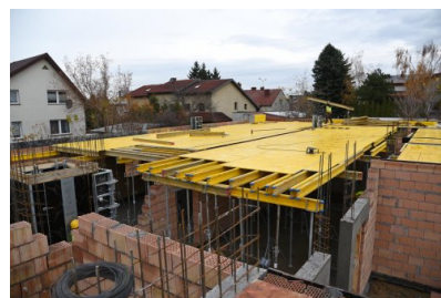
Budowa przedszkola w Dąbrowie Leśnej