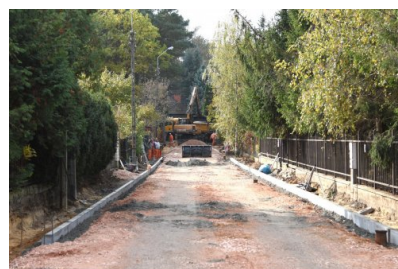
Budowa ul. Słonecznej