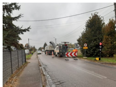
Prace kanalizacyjne w ul. Rolniczej