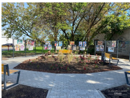
Park kieszonkowy ul. Warszawska