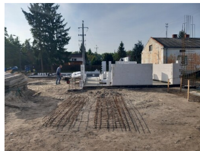
budowa świetlicy w Dziekanowie Leśnym