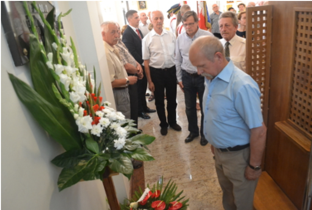
Delegacje kombatantów, Burmistrza Łomianek i Rady Miejskiej złożyły wieńce pod tablicą poświęconą Bohaterom Cudu nad Wisłą oraz mieszkańcom Burakowa, którzy zostali rozstrzelani podczas II Wojny Światowej.