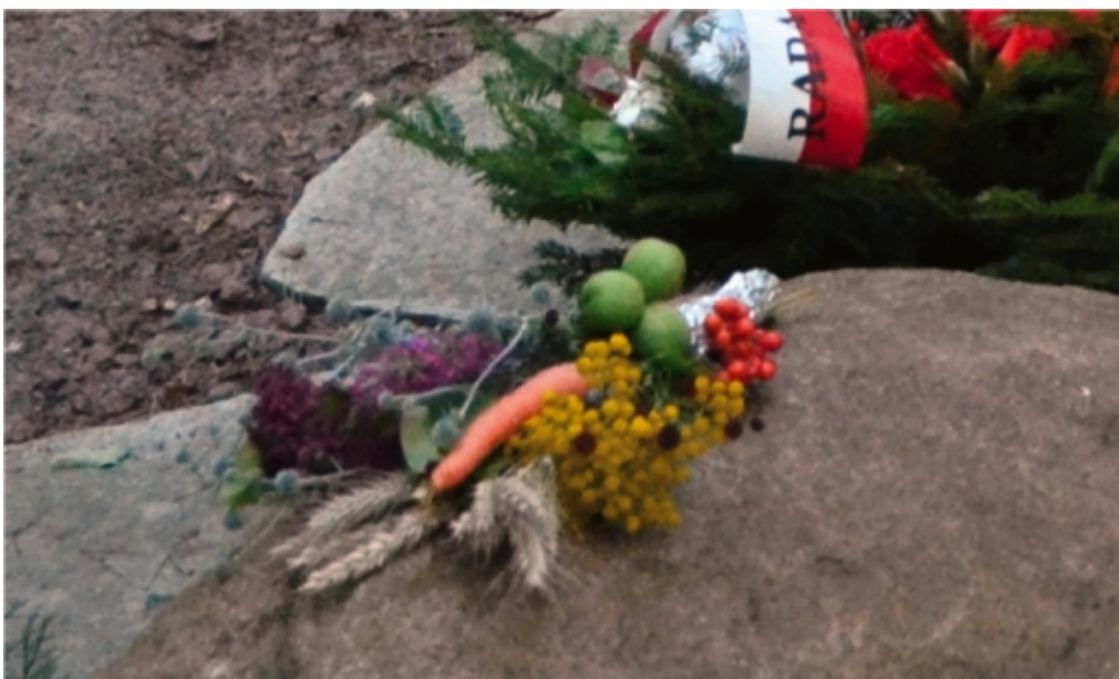
"Wiązanka Zarządu Osiedla Buraków - 15.08.2015 r."

Zero szacunku dla bohaterów, zero dla mieszkańców!