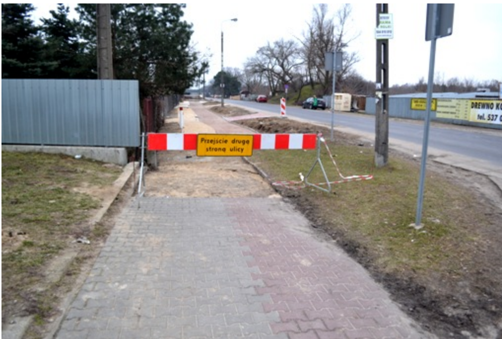
ścieżka rowerowa wymagająca przebudowy i dostosowania do projektu

Bezpośrednio po wyborach samorządowych, jeszcze pod koniec 2014 roku, ruszyło wiele blokowanych dotychczas inwestycji. Udało się też pozyskać miliony złotych z Unii Europejskiej na ich realizację. Pomimo tego, że opozycja ma mniejszość w Radzie Miejskiej, dalej próbuje różnymi metodami przeszkadzać w realizacji tak długo oczekiwanych przez mieszkańców projektów.