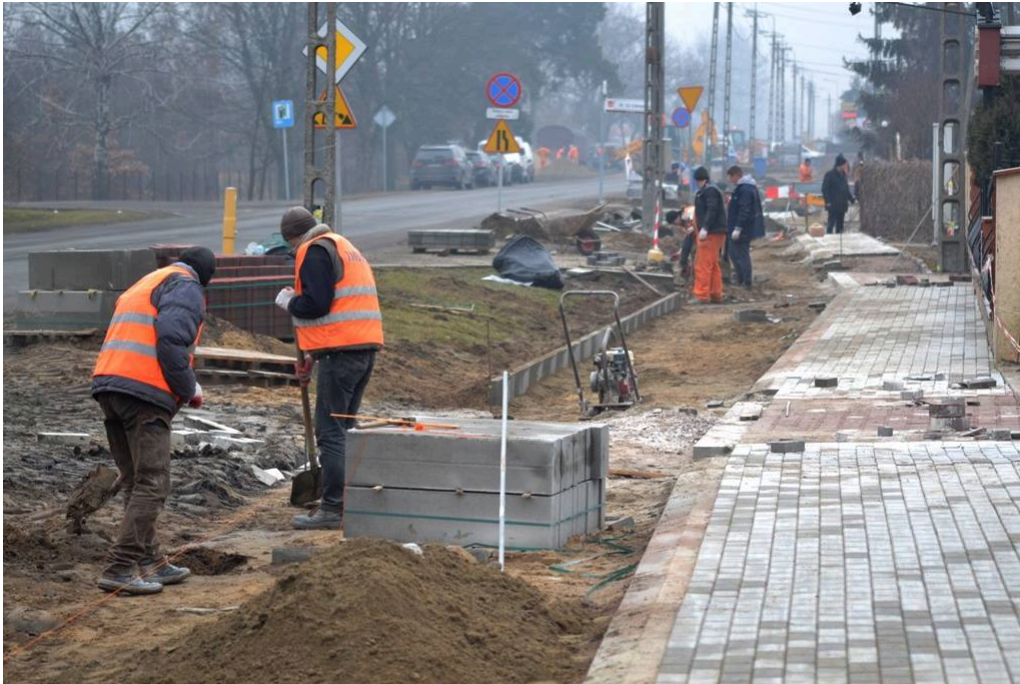
obecnie budowana ścieżka rowerowa wzdłuż ul. Warszawskiej na odc. Brukowa-Parkowa

Bezpośrednio po wyborach samorządowych, jeszcze pod koniec 2014 roku, ruszyło wiele blokowanych dotychczas inwestycji. Udało się też pozyskać miliony złotych z Unii Europejskiej na ich realizację. Pomimo tego, że opozycja ma mniejszość w Radzie Miejskiej, dalej próbuje różnymi metodami przeszkadzać w realizacji tak długo oczekiwanych przez mieszkańców projektów.