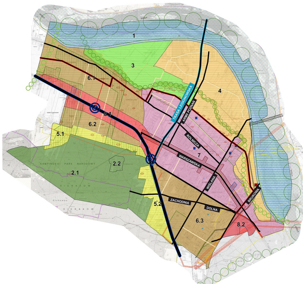
mapa gminy Łomianki z naniesionymi projektowanymi trasami dróg (aby powiększyć, kliknij w obrazek)

- W Łomiankach oprotestowuje się wszystko. Każda droga bez względu na to czy jest lokalna czy ma 100, 20 czy 500 metrów, jest oprotestowana. Skatepark przed ICDS był oprotestowany, boisko przy ICDS było oprotestowane, ścieżki rowerowe tak samo, szkoła w Dąbrowie, przedszkole w Dziekanowie, wszystko jest oprotestowywane - zauważył Wiceburmistrz Rusiecki.