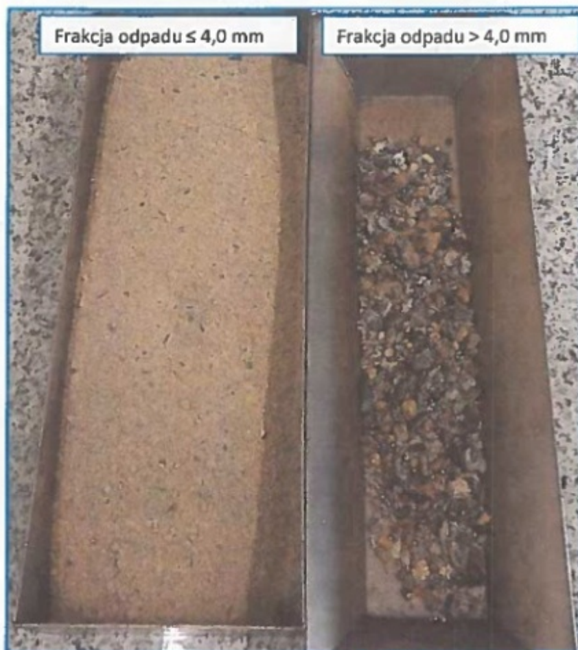
Zdjęcie 4. Wydzielone frakcje próbki odpadu paleniskowego (popiołu) \leq 4,0 mm oraz > 4,0 mm

W całym sezonie (od 1 września 2017 r. do 6 kwietnia br.) podjęto 422 interwencje. Warto w tym miejscu zaznaczyć, że większość z nich została przeprowadzona na wniosek samych mieszkańców! W tym czasie wystawiono 15 mandatów karnych. Jeden z mieszkańców odmówił oględzin pieca, więc - na podstawie ww. art. 225 § 1 ustawy kodeks karny - wniosek skierowano do Prokuratury Rejonowej Warszawa Żoliborz.