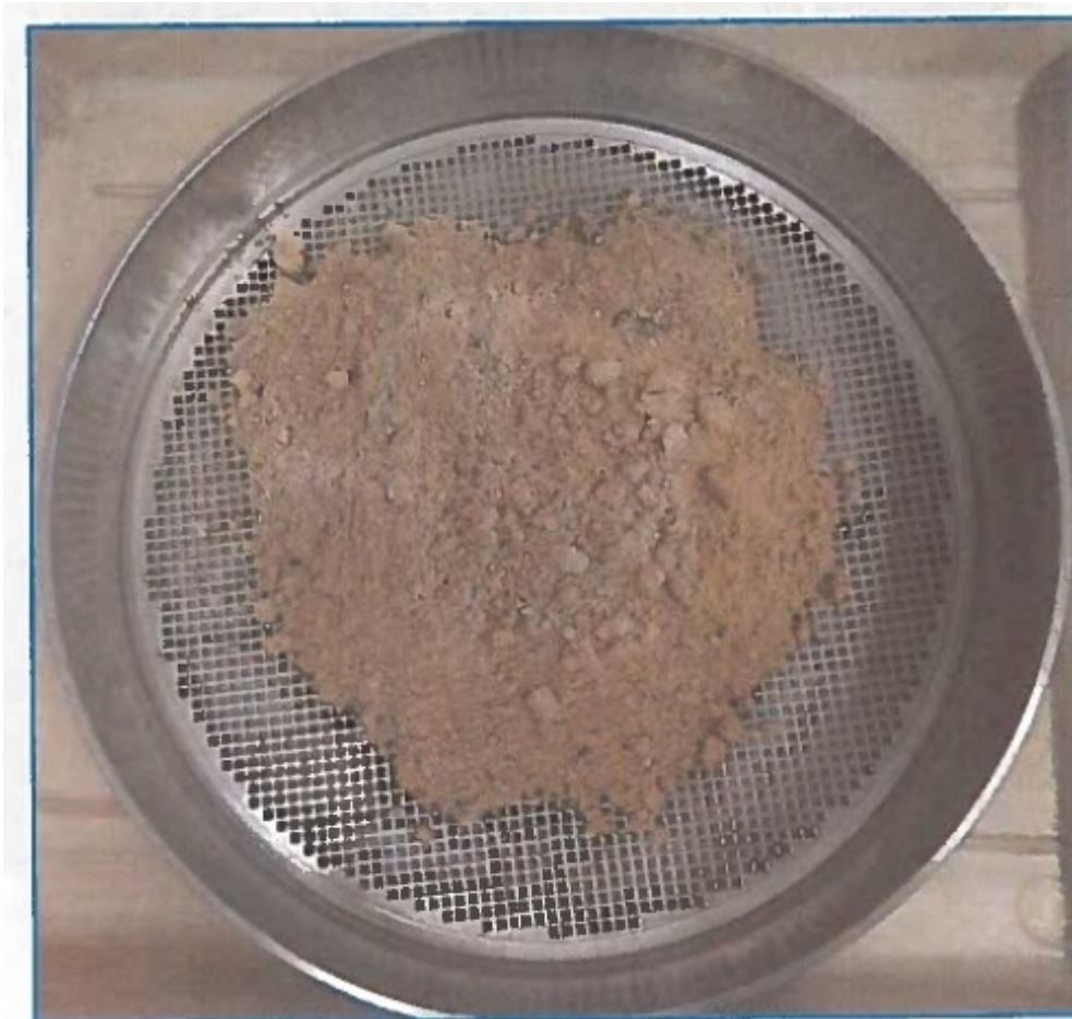
Zdjęcie 3. Wygląd próbki odpadu paleniskowego (popiołu) po wysypaniu na sicie

- Na podstawie przeprowadzonej oceny morfologicznej oraz wykonanych badań fizykochemicznych dla próbki o numerze plomby H1156403, stwierdzono termiczne przekształcanie (spalanie niedozwolonych substancji (śmieci/odpadów) w piecu, z którego została pobrana próbka przez Straż Miejską w Łomiankach - czytamy w ekspertyzie przygotowanej przez CLP-B.