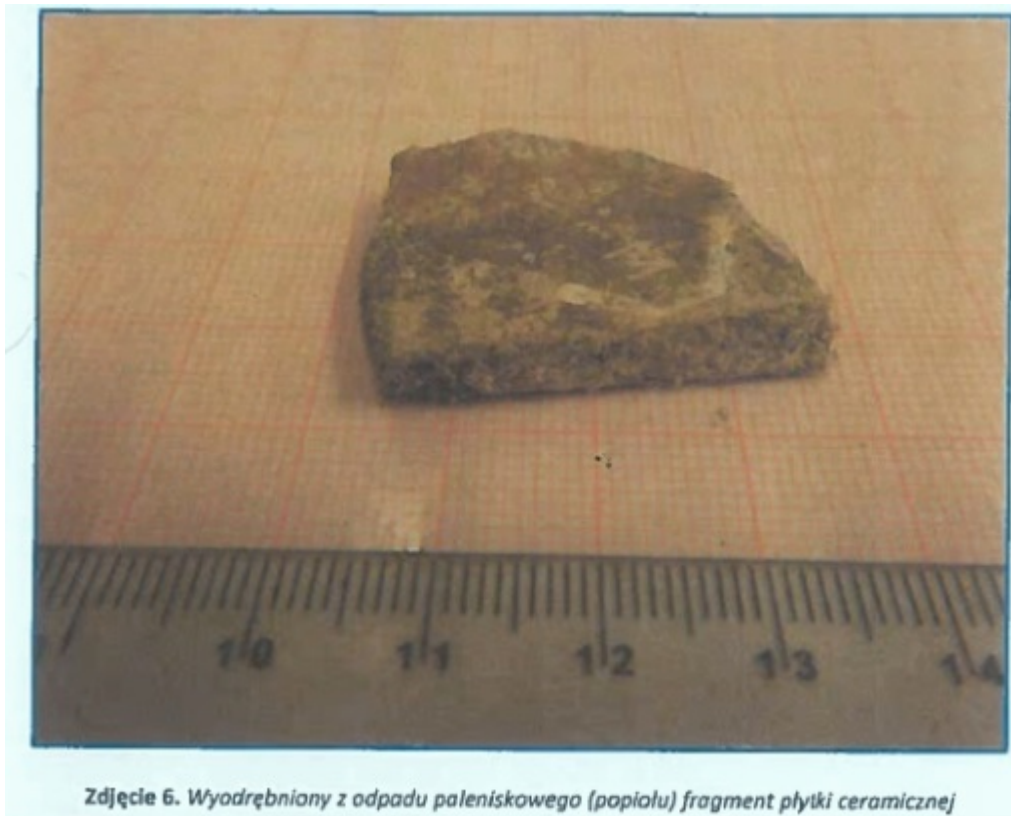
Zdjęcie 6. Wyodrębniony z odpadu paleniskowego (popiołu) fragment płytki ceramicznej

W pobranej próbce stwierdzono obecność niedozwolonych elementów takich jak: gwoździe, fragmenty gałęzi, a także fragment płytki ceramicznej. Ponadto ustalono, że wartość cynku przekroczyła o 40% poziom dozwolony dla tzw. czystego popiołu, będącego legalnie dopuszczonym do stosowania w kotłach centralnego ogrzewania.