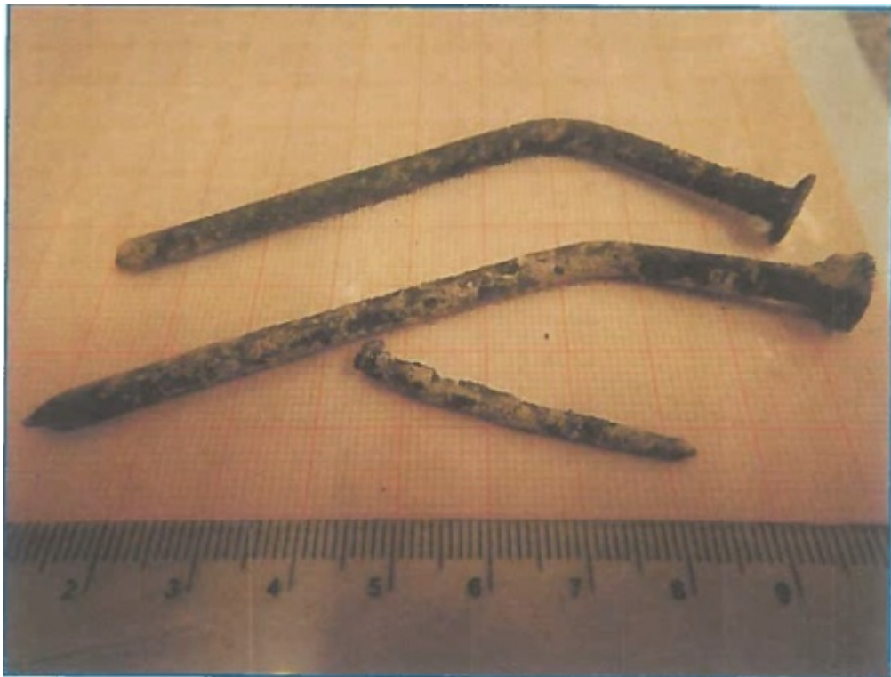
Zdjęcie 7. Wyodrębnione z odpadu paleniskowego (popiołu) gwoździe

Straż Miejska w Łomiankach, zgodnie z deklaracjami, rozpoczęła badanie próbek pobranych z palenisk mieszkańców Łomianek. W jednej z nich stwierdzono obecność gwoździ, fragmenty płytek ceramicznych oraz znaczne przekroczenie norm metali ciężkich. Sprawa znajdzie finał w sądzie.