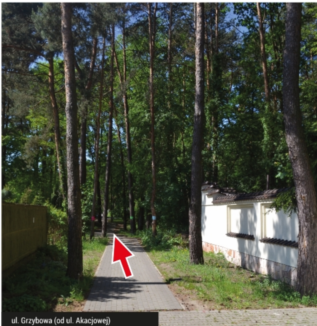
ul. Grzybowa (od ul. Akacyjowej)

Urząd Miejski chce udroźnić ul. Grzybową, która od lat jest nieprzejezdna z powodu drzew rosnących na środku drogi. Te uniemożliwiają przejazd straży pożarnej i karetki pogotowia w przypadku pilnych interwencji. Mimo to opozycja polityczna próbuje zablokować rozpoczęcie prac, których celem jest poprawa bezpieczeństwa okolicznych mieszkańców.