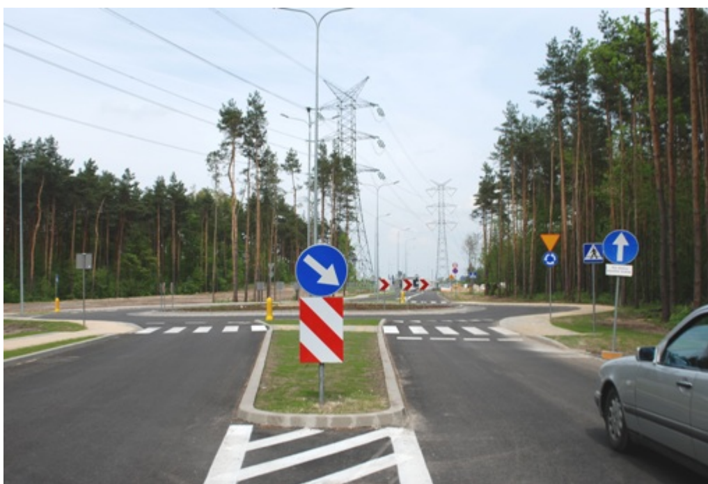
rondo - ul. Brukowa róg Akacjowej

Niestety, radni nie zgodzili się na nazwy dla trzech rond przy ul. Brukowej (u zbiegu Akacjowej, Stary Tor i Długiej). Propozycje nazw zostały zgłoszone przez mieszkańców Łomianek między innymi przez nasze lokalne Koło Związku Kombatantów i Byłych Więźniów Politycznych, Światowy Związek Żołnierzy Armii Krajowej czy stowarzyszenie Dobro Wspólne. Pomimo takich wniosków, radni opozycji mieli obiekcje i uchwałę przeniesiono do prac w komisji. Radnym nie podobały się nazwy rond „Bohaterów Ziemi Łomiankowskiej”, „Żołnierzy Wyklętych” czy „mjr Stanisław Barana”.