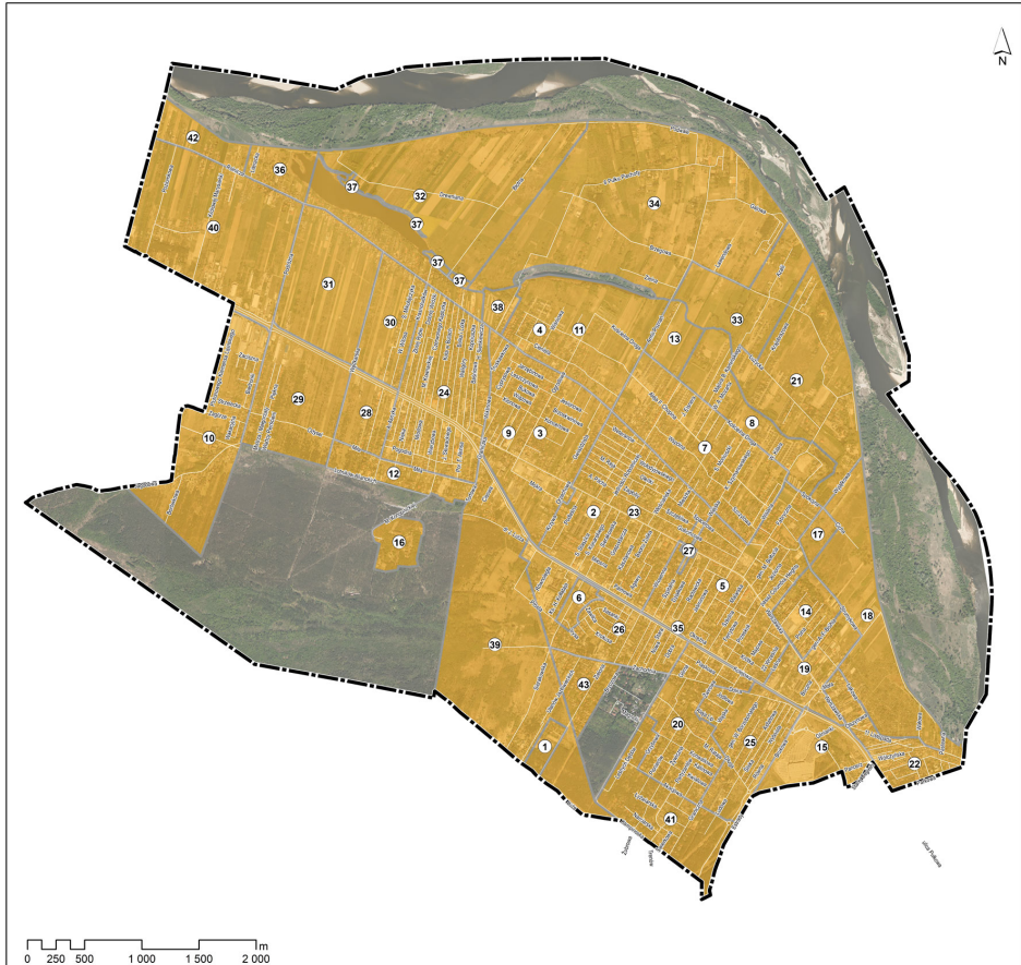
Tabela obowiązujących planów miejscowych